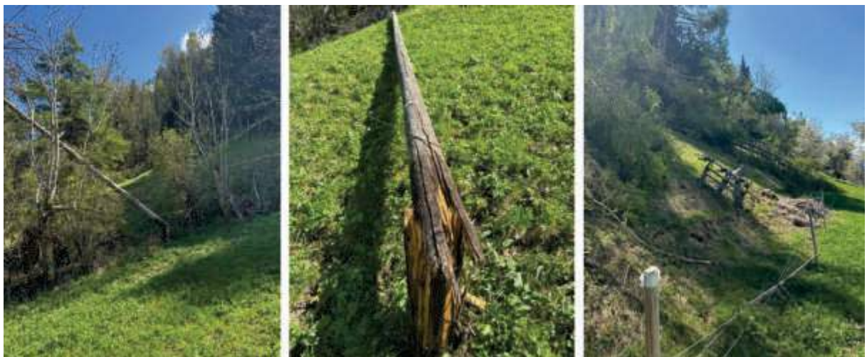
In der Region Bürchen/ Unterbäch kam es zum Abriss eines Leiters der 16kV-Weitspannungslleitung.